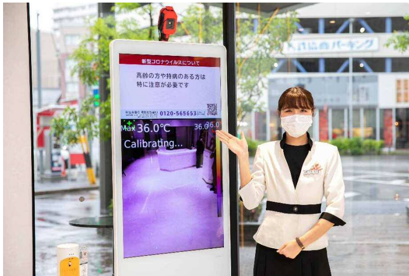
サーモグラフィーの設置