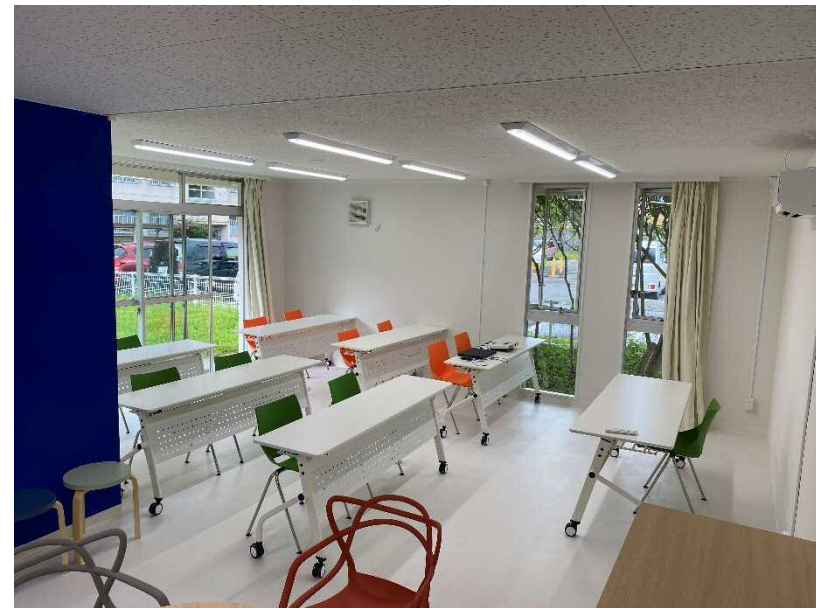
仙台中山団地 集会場の活用