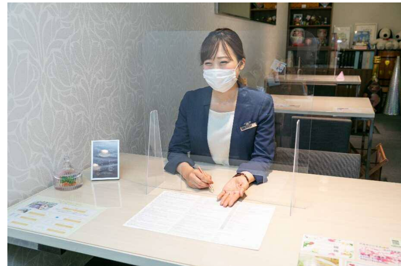
アクリル板を設置した上での接客