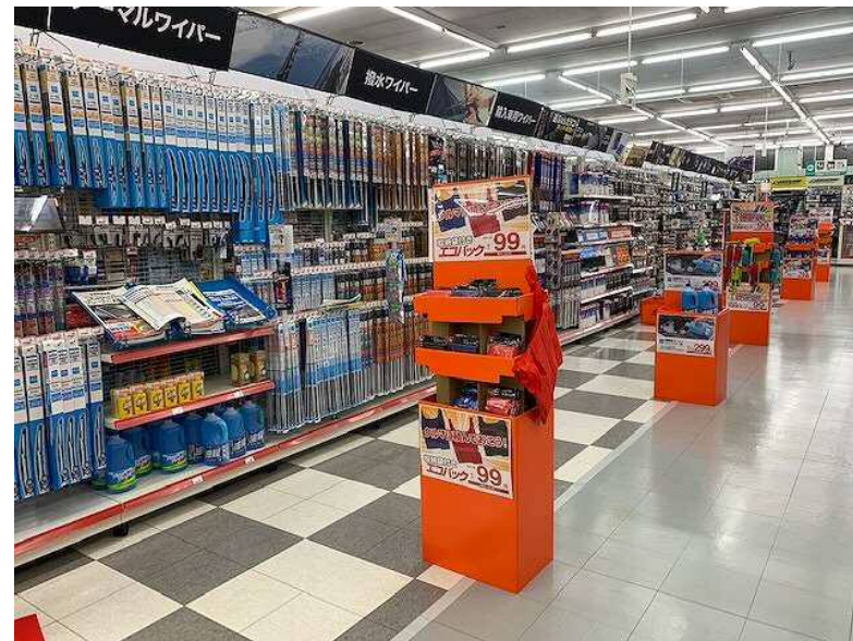
スーパーオートバックス246江田