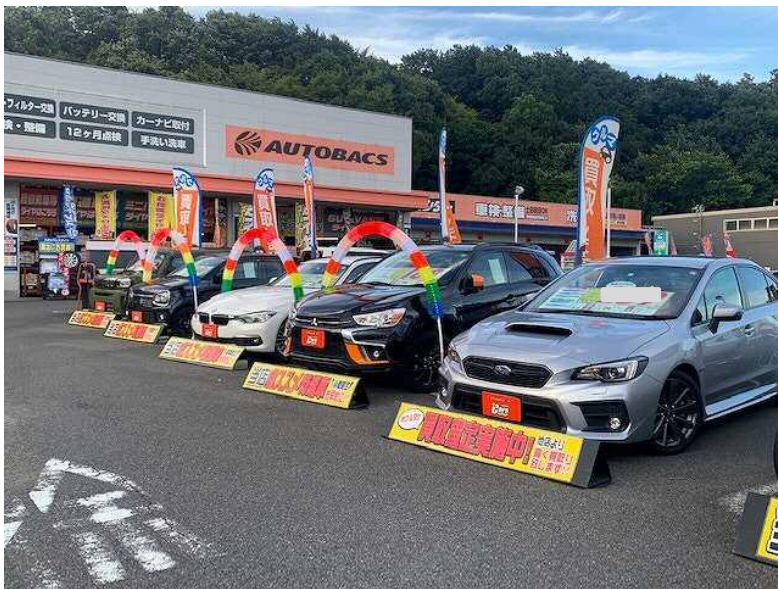
オートバックス多摩境